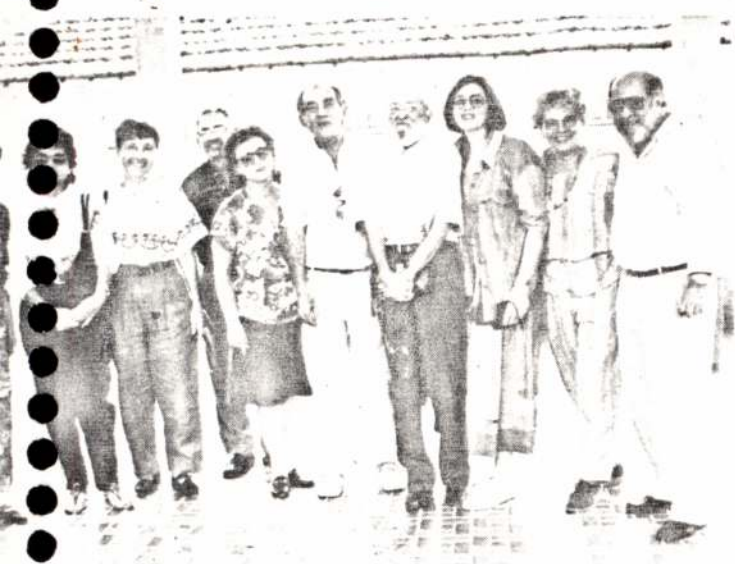
Os ex-colaboradores, no salão de reuniões